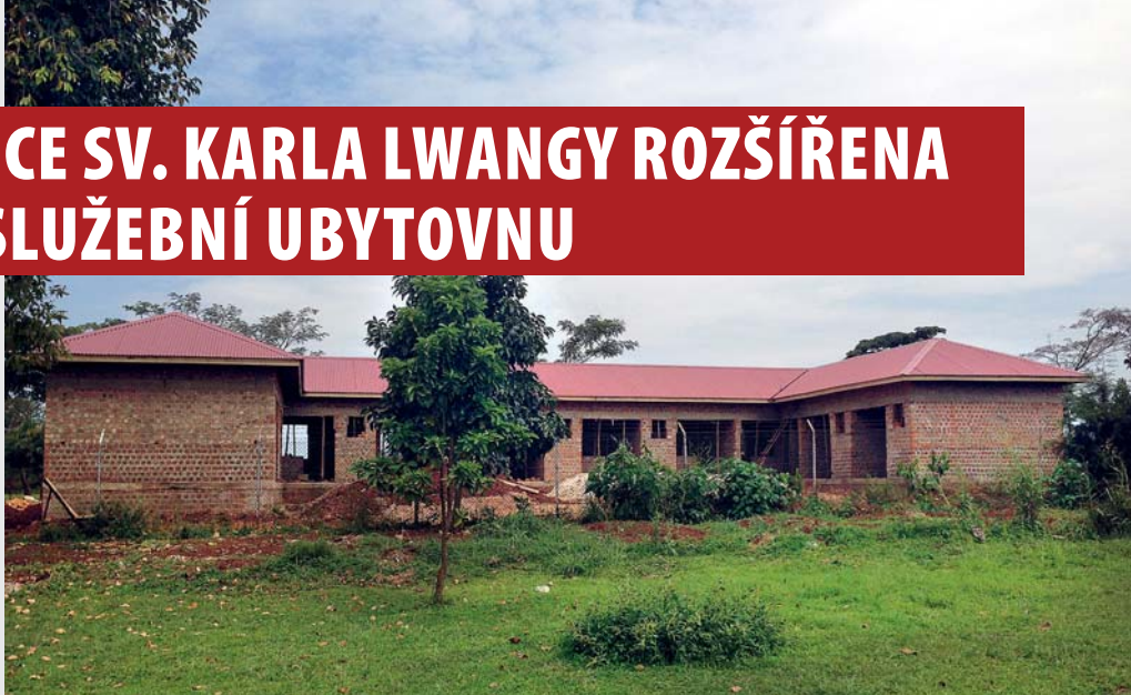
Ubytovna v průběhu stavby, srpen 2013

Deset jednolůžkových pokojů je již téměř připraveno k nastěhování. Využívat je budou např. pracovníci laboratoře, obsluha rentgenu a operačního sálu. Stavba byla zahájena v květnu t. r. a jejím uvedením do provozu získá nemocnice lepší možnost reagovat na některé akutní případy, s nimiž se na nemocnici pacienti obrací. □