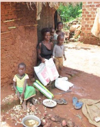
Lidé v Ugandě ztratili zdroje obživy. Pomohla charitní potravinová pomoc.

Mezinárodní poštovní styk byl sice oficiálně obnoven, ale stále se potýkáme s problémy v jednotlivých destinacích. Pošta do/z Běloruska již chodí