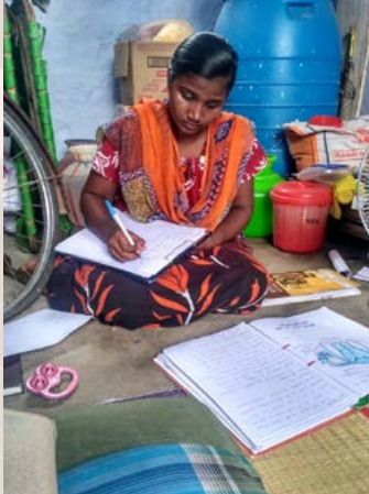
Studenti v Indii se věnují domácí výuce.

Dětem hradíme školné se zhruba půlročním předstihem. Školy toto školné nevracely, poskytovaly dálkovou výuku. Studentům zajišťujeme studijní materiály k domácí výuce. V každé zemi jsme realizovali humanitární pomoc – nakoupili jsme ochranné prostředky, desinfekce, potravinové ba-