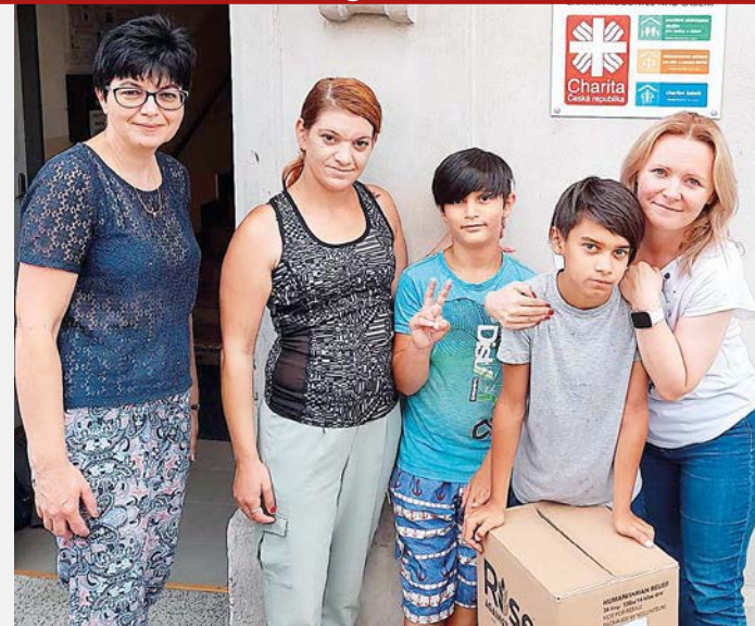
Balíčky pomohly rodině z azylového domu Charity Roudnice nad Labem a stovkám dalších rodin.

„Na pomoc dětem z nejchudších rodin jsme získali 30 palet se 1 400 balíčky potravin, které obsahovaly například rýži, luštěniny, konzervy, olej, džem a další výživově hodnotné potraviny,“ informuje Jarmila Lomozová z pražské Charity. „Balíčky jsme během letních prázdnin darovali