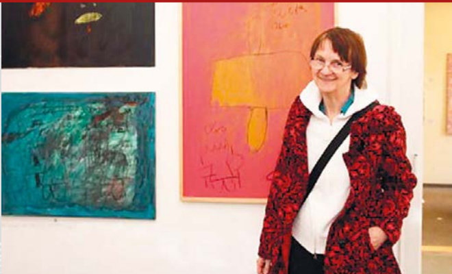
Charitní penzion U sv. Kryštofa vystavuje obrazy umělců s mentálním a duševním onemocněním.

Díky Nadaci ČEZ jsme získali dalších 150 tisíc korun na nákup notebooků pro děti ze sociálně slabých rodin . Notebooky jsme předali potřebným rodinám.