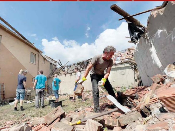
Lužice je jednou ze zasažených obcí, kam směřuje pomoc Charity.