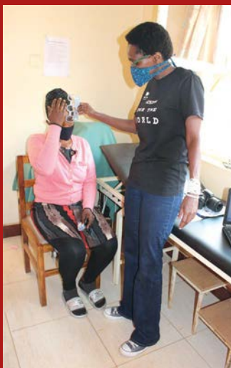
Česká nemocnice v Ugandě provozuje několik specializovaných ambulancí. Nově k nim přibýlo oční oddělení.

Ambulance tak může diagnostikovat refrakční vady u pacientů. Těm, jejichž zrak vyžaduje korekci, poskytuje na místě brýle.