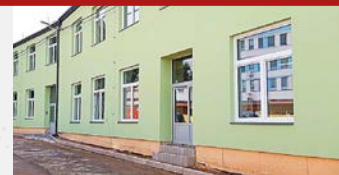
Služby vlašimské Charity najdou nyní lidé pod jednou střechou.

Bývalá továrna obuvi v centru Vlašimi se v posledních měsících změnila k nepoznání. Dlouhá léta nevyužívaný objekt proměnila Charita Vlašim v komunitní centrum a zázemí svých sociálních služeb. Pomohli jí v tom i dárci Tříkrálové sbírky.