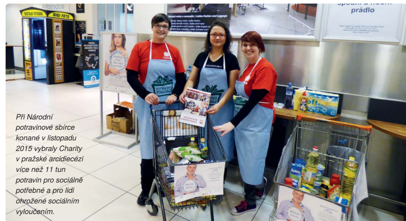
Při Národní potravinové sbírce konané v listopadu 2015 vybraly Charity v pražské arcidiecézi více než 11 tun potravin pro sociálně potřebné a pro lidi ohrožené sociálním vyloučením.

4 057 osob ohrožených sociálním vyloučením, lidí bez domova a sociálně slabých získalo v roce 2015 podporu Charity.