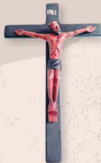
Dřevěný kříž s korpusem (550 Kč)