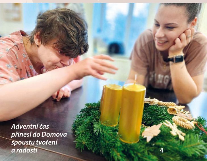
Adventní čas přinesl do Domova spoustu tvoření a radosti