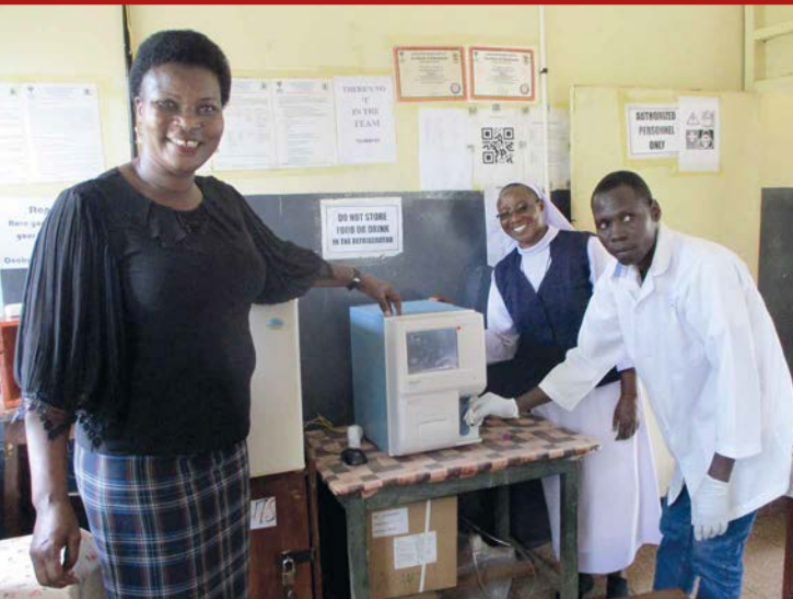
Personál Nemocnice Wesunire se raduje z nového vybavení, které výrazně zlepšilo péči o pacienty

Z dřevě střechy už neprší na pacienty, porodní sál má spolehlivý zdroj elektřiny a budoucí maminky mohou poprvé vidět své děti na ultrazvuku. Nemocnice sv. Josefa v Buyege a Nemocnice Wesunire se díky českým dárcům za poslední dva roky změnila k nepoznání.