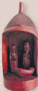
Vyřezávaný Betlém (1 150 Kč)