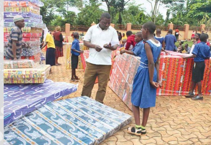
Naši vánoční výzvu „Matrace pro Ugandu“ již vyslyšeli první dárci. Díky jejich laskavosti jsme mohli zakoupit první várku matrací a udělat radost první skupince dětí. Více se dočtete na straně 14.

Další velkou výzvou je monitoring programu. Máme přes 2 800 dětí v desítkách škol rozestých v několika diecézích. Pravidelně kontrolujeme jejich docházku, prospěch a celkovou situaci. Je to logisticky náročné – naši zaměstnanci často cestují i do velmi odlehklých oblastí. Ale tenhle osobní přístup je klíčový. Díky němu můžeme rychle reagovat na případné problémy a zajistit, že pomoc skutečně míří tam, kde je potřeba.