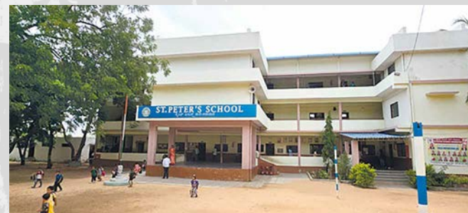
K současné ZŠ a SŠ sv. Petra bude přistavěn dvoupodlažní objekt s učebnami, laboratoř, tělocvičnou a hygienickým zázemím

Největší z projektů, ZŠ a SŠ Pražského Jezulátka v Chal-lakere v diecézi Shimoga, zajišťuje vzdělání 650 dětem. Nová třípodlažní budova nabídne deset moderních učeben, laboratoř, počítačovou učebnu a multifunkční sál pro 250 osob.