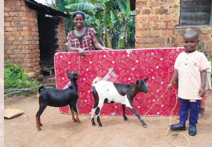
Dar dvou koz od českého dárcе potěšil chudou ugandskou rodinu

K pomoci vedla pracovníky Charity osobní zkušenost s fungováním Adopce na dálku®