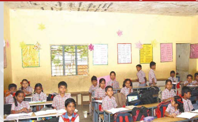
Vlhkost prostupující stropem v jedné z učeben ZŠ a SŠ Pražského Jezulátka ohrožuje bezpečné prostředí pro výuku žáků

Arcidiecézní charita Praha připravuje rozsáhlou podporu vzdělávání v indickém státě Karnátaka. V rámci tří významných projektů podpoří výstavbu nových školních budov, které poskytnou kvalitní vzdělání dětem z chudých rodin a sociálně znevýhodněných komunit.