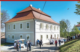
Zchátralá fara v Maršovicích prošla díky Charitě kompletní přestavbou

Charita Starý Knín kompletně zrekonstruovala fary v Maršovicích a Bratronicích, pro které už neměla církev využití. Sídli v nich nyní charitní sociální služby.