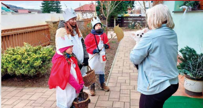
Koledování si už 25 let zachovává svůj tradiční ráz a kouzlo, které každý rok spojuje lidi napříč generacemi

Vaše dary pomáhají lidem v těžkých životních situacích a podporují charitní sociální služby. Každý vybraný příspěvek pomáhá v regionu, kde byl darován, a směřuje na konkrétní projekty podle místních potřeb. Arcidiecézní charita Praha letos výtěžek Tříkrálové sbírky využije na podporu rekonstrukce Domova sv. Václava. V zahraničí podpoří chudé rodiny v Uzbek-