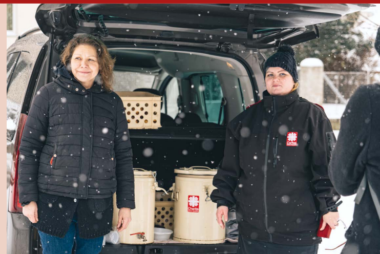
Potravinovou pomoc vydává Charita na Kobyliském náměstí každý den už šestým rokem

Denně vyrážejí terénní pracovníci přímo na ulici, aby vyhledávali lidi bez domova a informovali je o možnostech přespání či denních centrech.