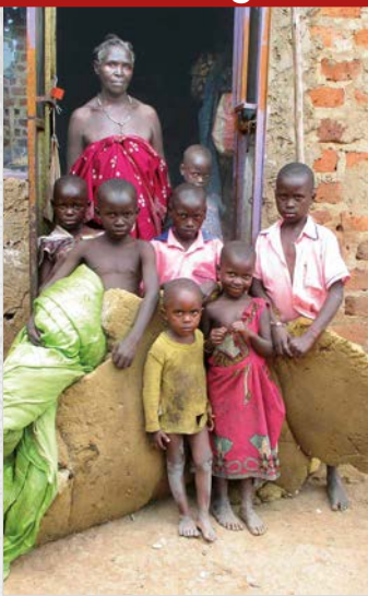
O sirotky se v Ugandě starají prarodiče nebo příbuzní, kteří si nákup nových matic nemohou dovolit

Situace je často ještě složitější, když děti sdílejí omezený