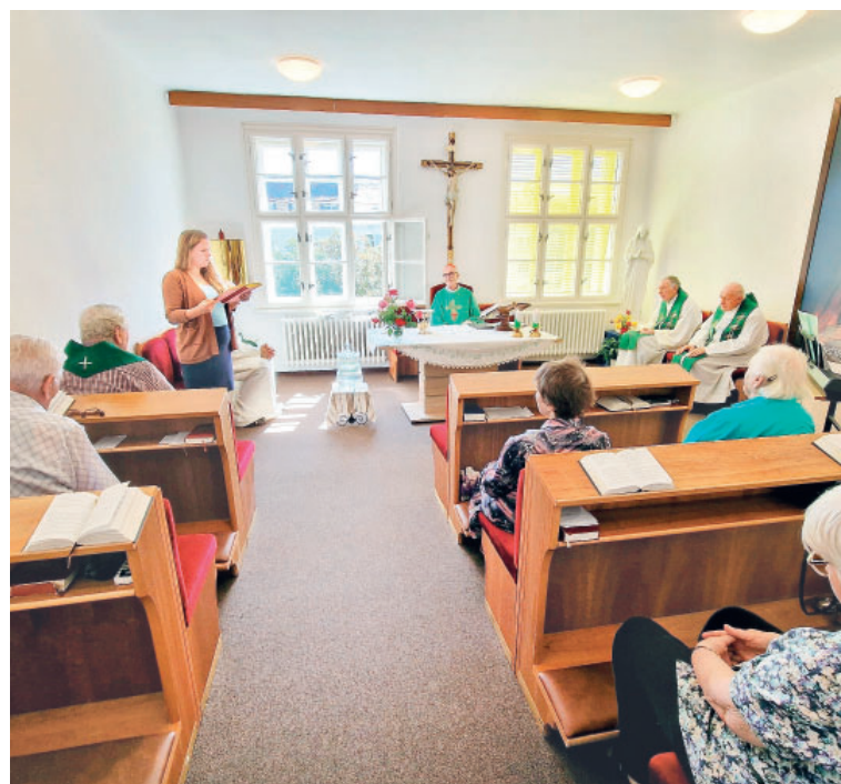
Duchovní rozměr života zůstává pro seniory klíčový i v dočasném působišti.

Během rekonstrukce Domova sv. Václava zajistila Arcidiecézní charita Praha jeho klientům náhradní ubytování. Větší část seniorů našla přechodný domov v charitním objektu v Třeboradicích, menší skupina se přestěhovala do kněžského semináře v pražských Dejvicích.