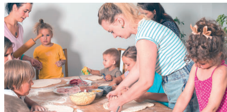
Při společném vaření si maminky užívají čas s dětmi (ilustrační snímek).