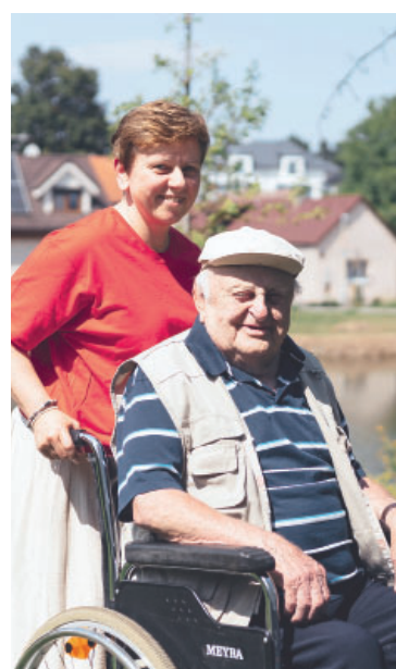
Třeboradice jsou součástí Prahy, přesto působí dojmem poklidné vesnice.

Dočasný domov tu díky tomu mohli najít senioři, kteří potřebují intenzivní péči a podporu – lidé upoutaní na lůžko, na invalidním vozíku či s omezenou pohyblivostí. „Jsou to lidé, kteří potřebují pomoc ve všech běžných každodenních činnostech – od hygieny přes podávání jídla až po polohování na lůžku,“ vysvětluje Sylvie Smidová. Každý den je k dispozici zdravotní sestra a jednou za čtrnáct dní přichází na vizitu lékař.