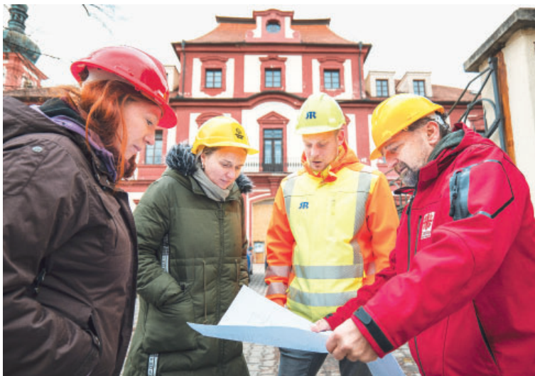
Rozsáhlá rekonstrukce Domova sv. Václava promění historickou budovu v moderní bezbariérové zařízení pro seniory.