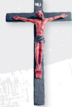
Dřevěný kříž s korpusem (550 Kč)