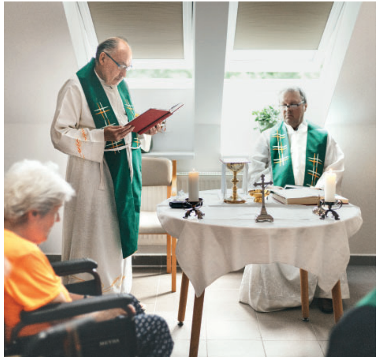
Domov sv. Václava slouží kněžím, jejich rodičům, řeholnicím a církevním pracovníkům, stejně jako těm, kteří chtějí žít v duchovním prostředí.

Opravu Domova sv. Václava mohla Arcidiecézní charita Praha zahájit ze-