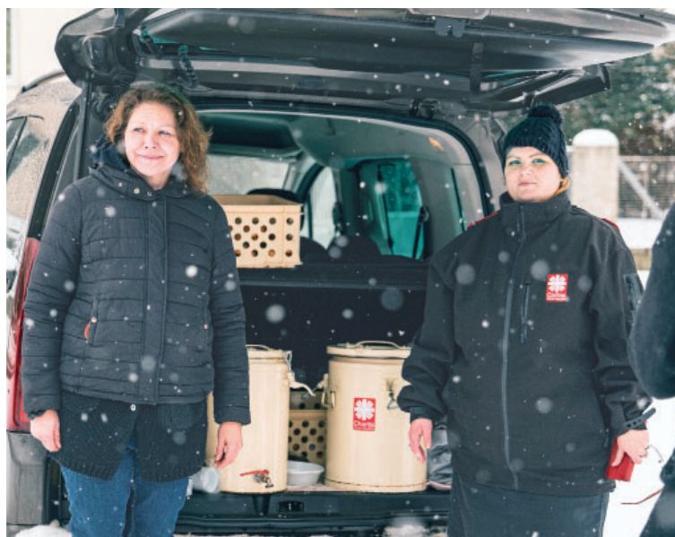
Charita stojí v první linii pomoci lidem bez domova v hlavním městě.

Zimní období je pro lidi bez domova nejrizikovějším časem roku. Každoroční mrazy přinášejí boj o přežití, kdy jen teplý přístřešek může zachránit život.