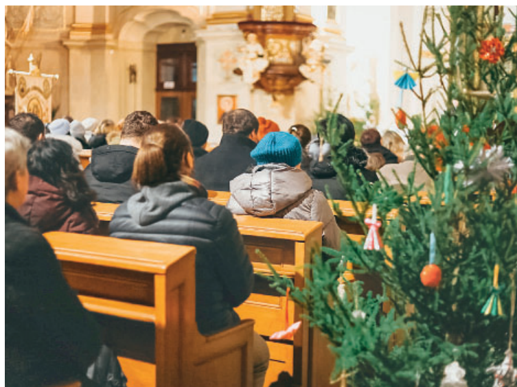
Kostel sv. Kajetána je během Vánoc otevřen denně, na Štědrý den od 10 do 18 hodin, na Silvestra od 10 do 22 hodin. Více na www.svatykajetan.cz .

Arcidiecézní charita Praha srdečně zve do kostela Panny Marie Matky ustavičné pomoci a sv. Kajetána v pražské Nerudově ulici. V adventu i o Vánocích je hned několik důvodů, proč navštívit kostel, který se díky Charitě stal centrem modlitby za pomoc lidem v nouzi.