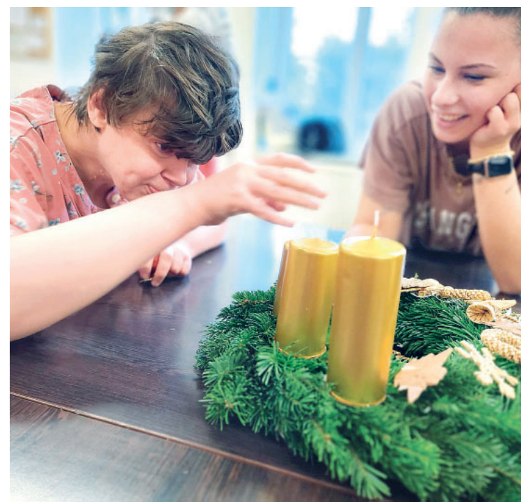
Adventní čas přinesl do Domova svaté Rodiny spoustu radosti a tvoření.

Návštěva dětí z mateřské školky byla další z nezapomenutelných událostí. „Bylo dojemné sledovat, jak děti přinesly vlastnoručně upečené perníčky a rozdávaly je našim klientům,“ vzpomíná Táňa Wieluchová. „Když děti ří-